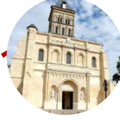
Basilique St Seurin