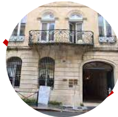
Musée du vin et du négoce