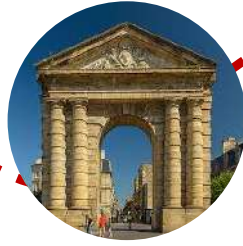
Place de la Victoire