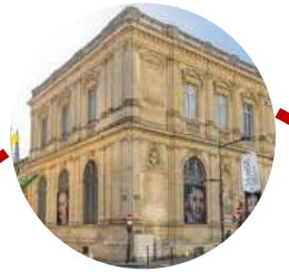
Musée des beaux arts