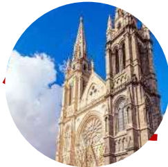
Église St Louis des Chartrons