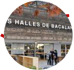
Halles de Bacalan