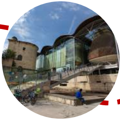
Tribunal Judiciaire Fort du Hâ