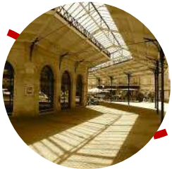
Halle des Chartrons