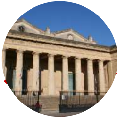
Palais de justice