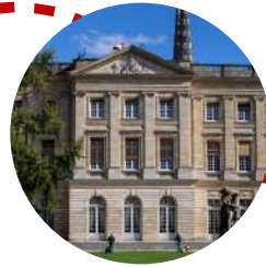
Hôtel de Ville Palais Rohan