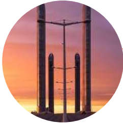
Pont Jacques Chaban Delmas