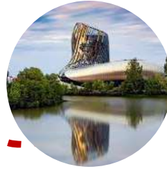
Cité du Vin