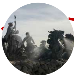
Monument aux Girondins