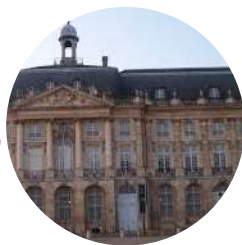
Musée national des Douanes