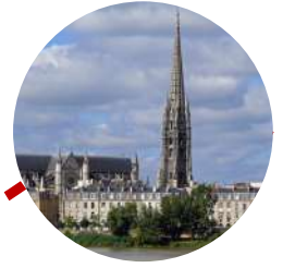
Quartier St Michel