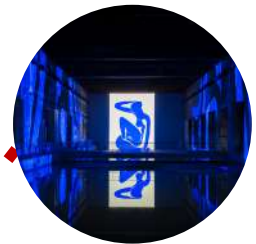
Bassins des Lumières