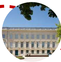
Muséum de Bordeaux sciences et nature