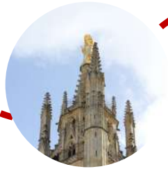
Cathédrale St André Tour Pey Berland