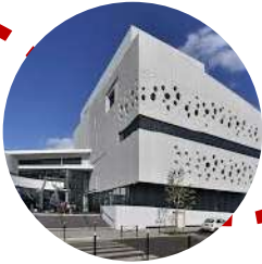
Musée mer marine