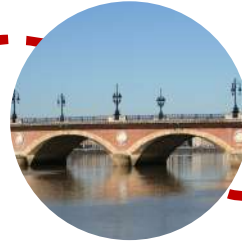
Pont de Pierre