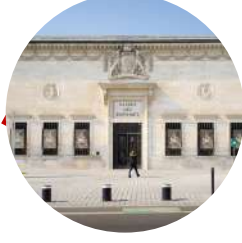
Galerie des Beaux Arts